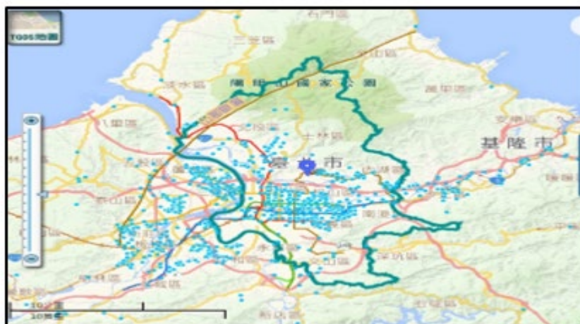
圖5 臺北市近五年淹水點

大臺北地區為一盆地地形，外圍山區環繞，坡度陡峭，大小河川皆由平原區匯集於淡水河，每逢颱風及豪雨，常因降雨集中，使洪流快速湧向盆地區，每年夏、秋季期間均有梅雨、雷陣雨發生，常造成本市部分地區積水。颱風主要生成季節是在7至10月，平均約有18.3個，佔全年颱風生成總數的69%，若颱風停留時間過久及特殊嚴重水患，以民國90年9月中旬納莉颱風為例，於本市降下豪大雨量，遠超過臺北市下水道系統之設計容量，除造成臺北市捷運及臺鐵臺北車站淹水外，亦使內湖、南港、信義、松山等行政區幾乎全區淹水(如圖5)。