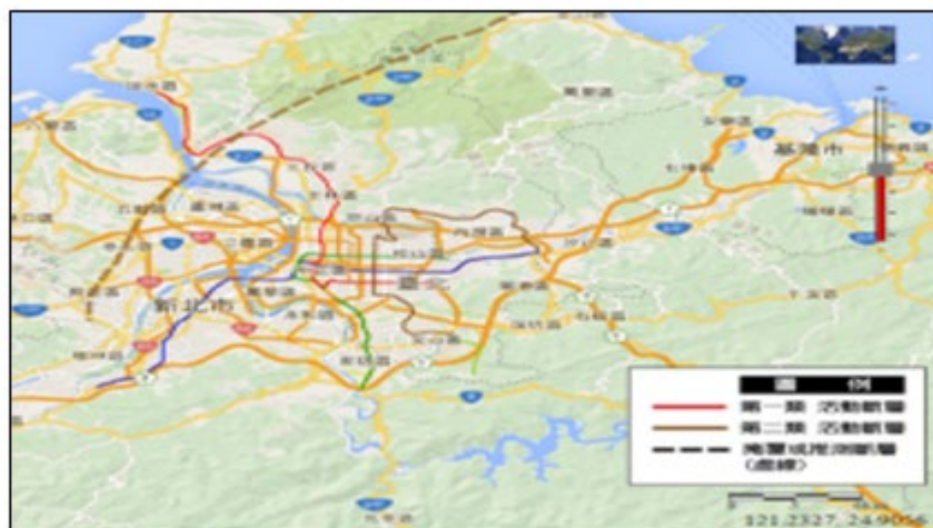
圖3 臺北市鄰近活動斷層分布圖

山腳斷層呈北北東走向，自樹林、新莊一帶向東北延伸至臺北市北投區再進入新北市金山區，再延伸進入海中，依據最新地質調查結果尚有海外延伸段，山腳斷層全長約至少80公里(如圖3)。