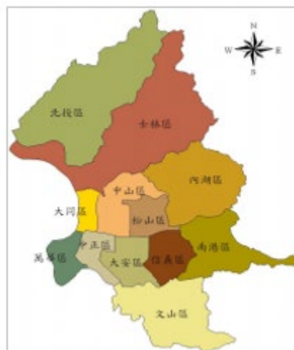
圖1 臺北市行政區圖

本市四周均與新北市交界，土地面積約271.7997平方公里，轄區劃分為十二個行政區，分為松山區、大同區、內湖區、士林區、信義區、萬華區、大安區、中山區、南港區、北投區、中正區及文山區，設籍臺北市人口約270萬人(如圖1、圖2)。