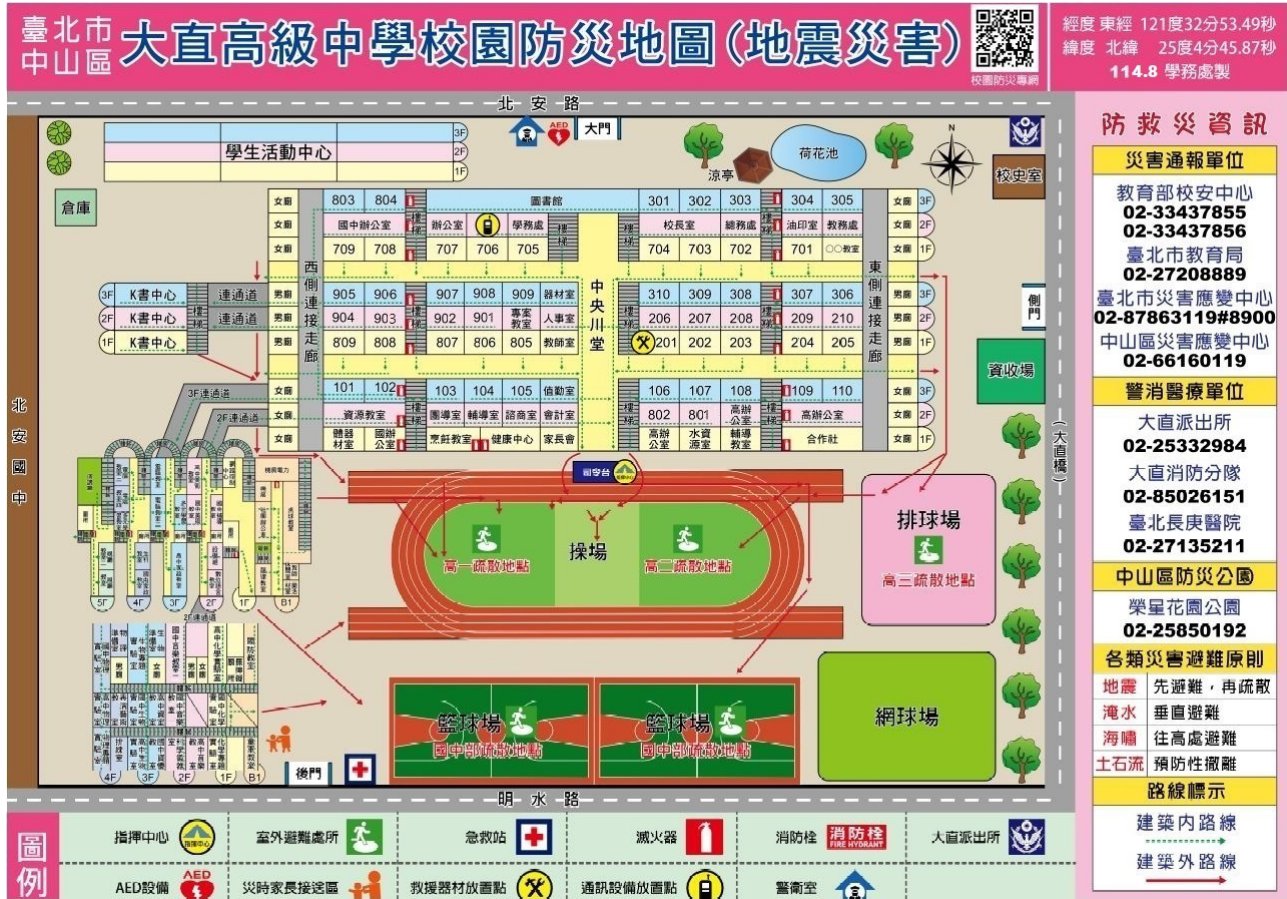
臺北市中山區大直高級中學一校園防災地圖(操場集合位置)