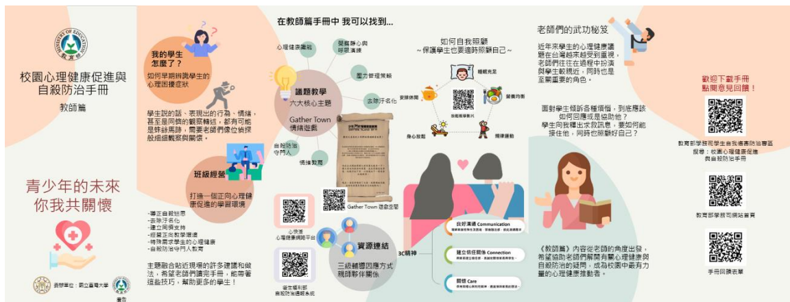
校園心理健康促進與自殺防治手冊教師篇