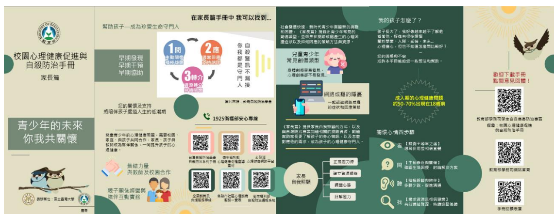
校園心理健康促進與自殺防治手冊家長篇