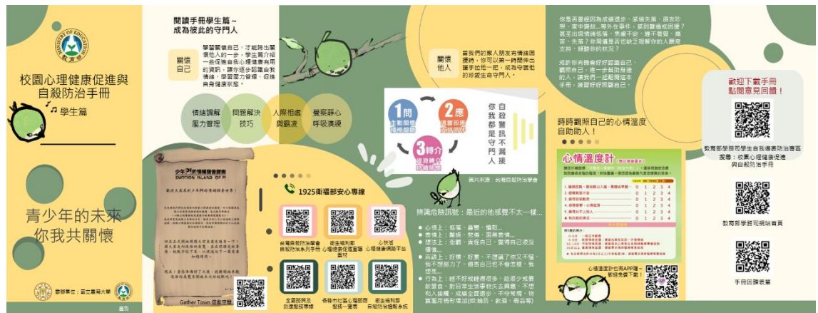
校園心理健康促進與自殺防治手冊學生篇