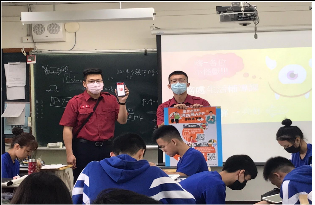
說明：110-2 學期協請大直消防分隊入校實施防災 APP 宣導