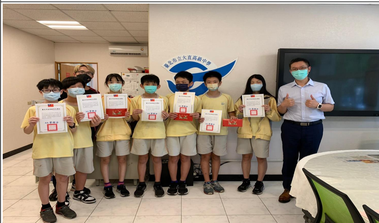
說明：參加「111 年度防災教育主題短片動畫、遊戲甄選」榮獲特優及佳作