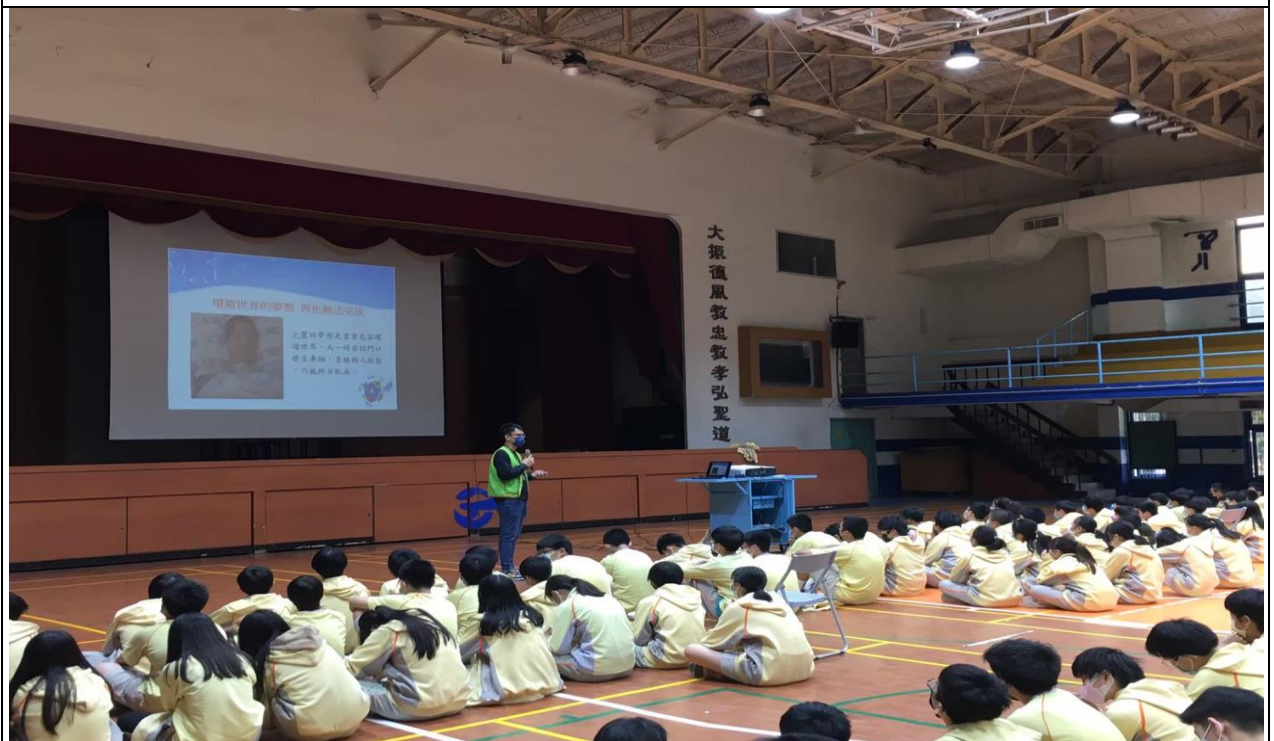
說明：111/05/17 交通安全講座