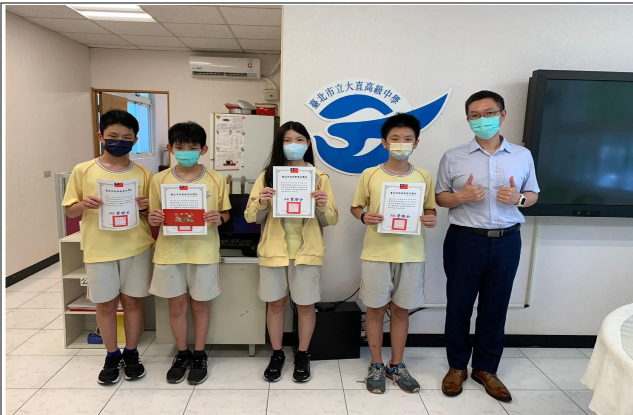
說明：參加「111 年度防災教育主題短片動畫、遊戲甄選」榮獲特優及佳作