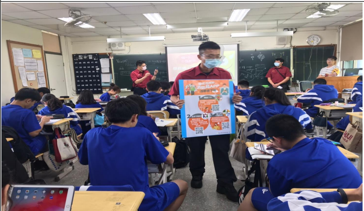
說明：110-2 學期協請大直消防分隊入校實施防災 APP 宣導