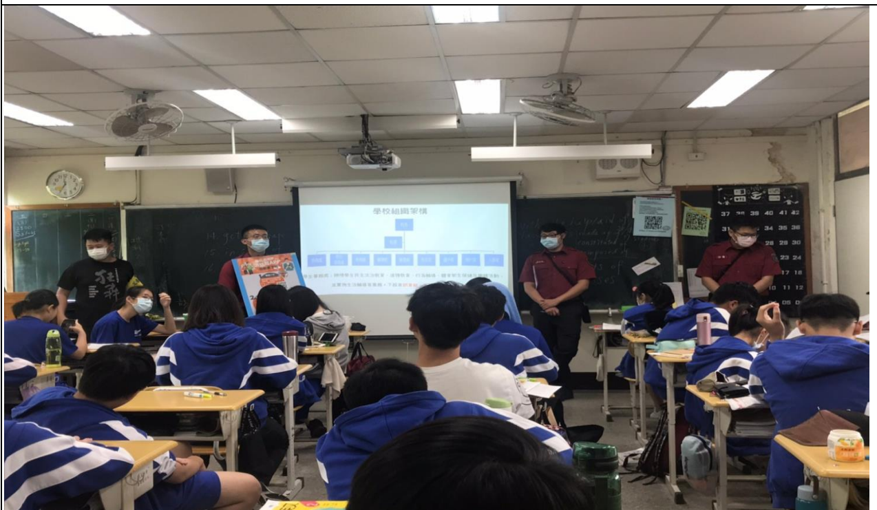
說明：110-2 學期協請大直消防分隊入校實施防災 APP 宣導