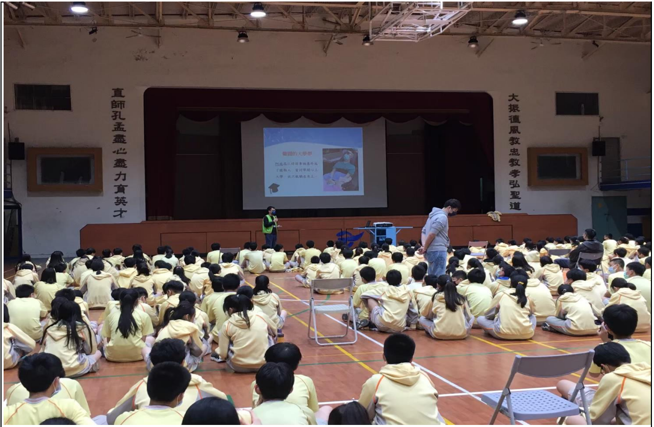
說明：111/05/17 交通安全講座