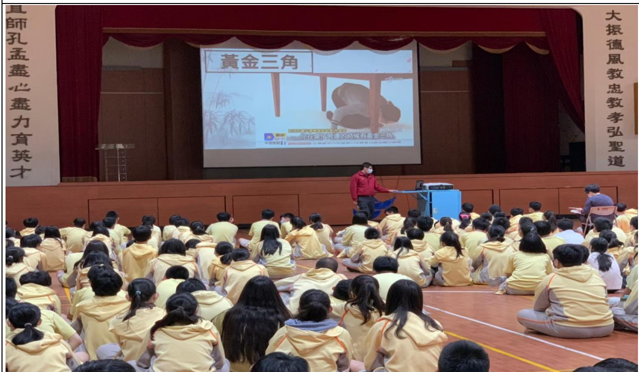
說明：111/04/1 協請大直消防分隊入校實施防災知識宣導