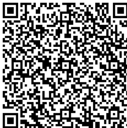
【午餐請假暨加退訂申請表】