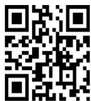
大直高中校園 防災教育IG

另外當學校有災害發生時也是統一告知家長之約定通訊管道，歡迎訂閱追蹤，掌握防災新知。