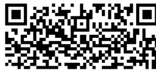
電子生涯手冊家長說明簡報